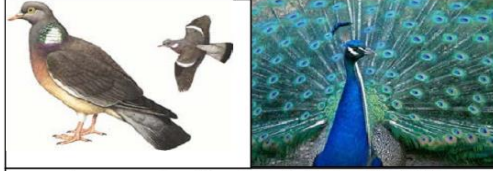
ب - اختيار الشريك الجنسي يتم بناء على مجموعة من الخصائص التي ترتبط بالنمط الوراثي للفرد . ( استعراض زاهي مميز للريش عند ذكر الطاووس )

1. انطلاقا من معطيات الوثيقة 1 ومكتسباتك، استخراج أهم العوامل المتدخلّة في الانتقاء الطبيعي وكيفية تدخل كل عامل