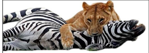
أ - ليس لمختلف الكائنات المؤهلات نفسها على البقاء قيد الحياة